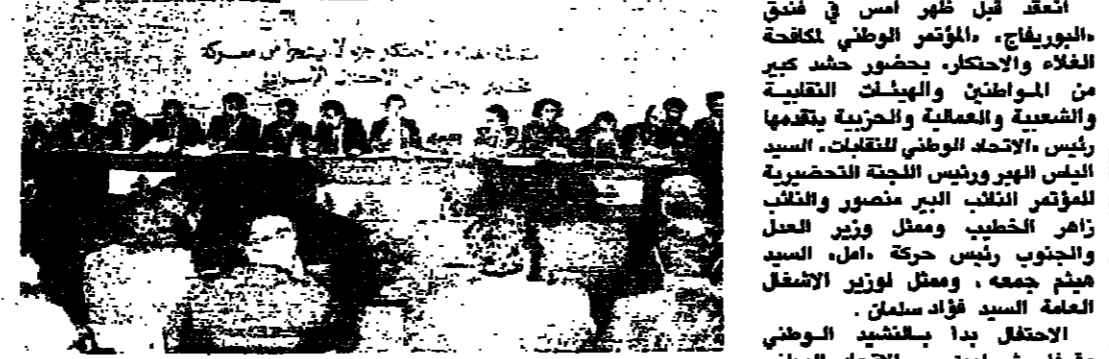
الاجتماعات التي جرت في دمشق